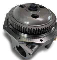
3520211 - C15 Bomba de agua