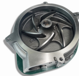
3362213 - C15 Acert / C18 Bomba de agua