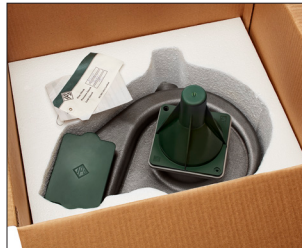
El cono y la tapa de protección impiden el paso de la suciedad