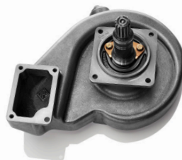
4160610 - Cat 3500 Bomba de agua