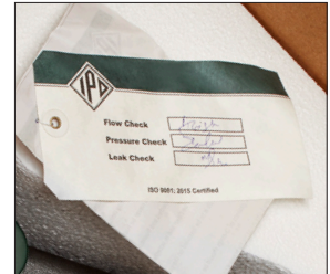
La etiqueta firmada acredita la inspección personal de cada bomba para verificar su estanqueidad, presión y caudal