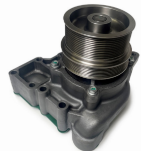
5406048 - Cummins X15 / ISX15 Bomba de agua