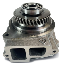
1727764 - G3304 y G3306 / Bomba de agua