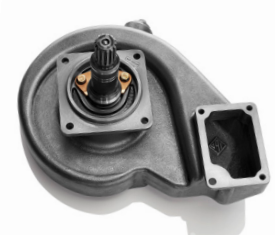
4160609 - Cat 3500 Bomba de agua