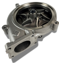
3520200 - 3412/C27/C32 Bomba de agua