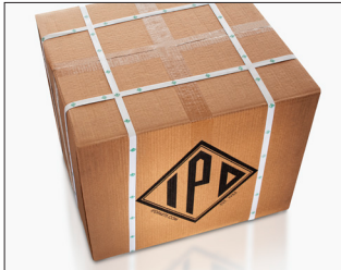
Los precintos resistentes que rodean cada caja hacen que su bomba llegue en perfectas condiciones