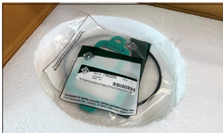
Cada bomba viene con un juego de sellos (empaque y juntas tóricas) para ayudarle con la instalación.

Compre bombas nuevas o reconstrúyalas: ahora puede comprar las piezas que necesita para reconstruir su bomba de agua IPD y dejarla funcionando como nueva. Las siguientes bombas de agua y kits de reparación fabricados por IPD están disponibles. Cada kit de reparación viene en un innovador empaque IPD que evita golpes, daños y suciedad con las piezas cuidadosamente etiquetadas. En el interior encontrará un rotor, un eje, un conjunto de sellos, un tapón no roscado, un retenedor de acero, un rodamiento cónico, un filtro y un tornillo fabricados con materiales de calidad y diseñados para resistir las aplicaciones más exigentes.