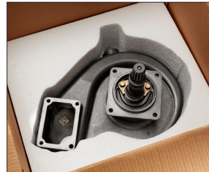
Insertos de espuma personalizados que cubren la bomba para brindar la máxima protección.