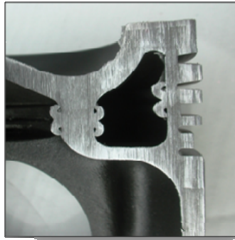
Galerie de refroidissement interne de l'huile